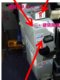
「紙幣」 Note slot