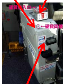
「紙幣」 Note slot